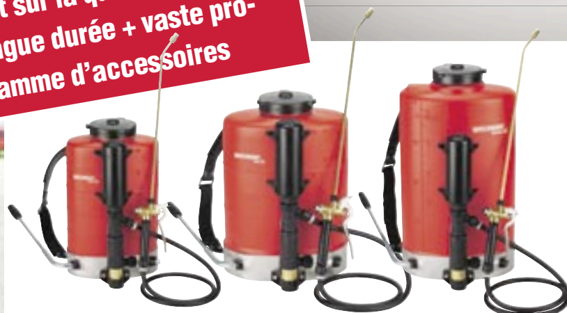
Flox 10 l